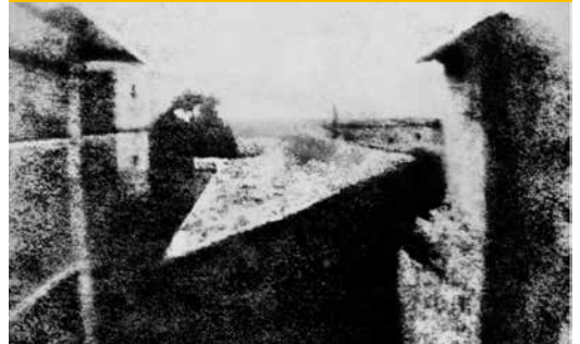
Première photographie : Point de vue du Gras

Le Point de vue du Gras est la première photographie permanente réussie et connue de l'histoire de la photographie, prise par l'inventeur français Nicéphore Niépce (1765-1833) en 1826 ou 1827 dans sa maison de Saint-Loup-de-Varenes près de Chalon-sur-Saône en Bourgogne.