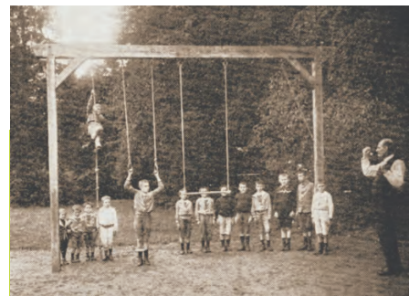
Cours de gymnastique à Avernès vers 1912